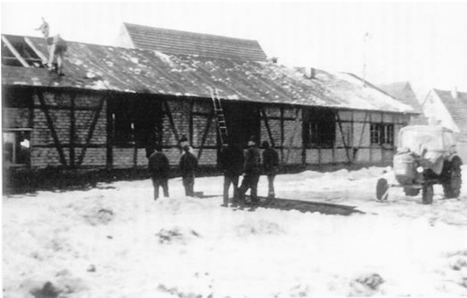
Das Foto wurde 1965 kurz vor dem Abriss der Turnhalle gemacht.

Der Bau sollte diese Woche in Angriff genommen werden, jedoch warf am Samstag die Gemeindevertretung ihren früheren Beschluss unbegreiflicherweise um und ist nunmehr der finanziell sehr schwache Turnverein doch gezwungen, aus eigenen Mitteln einen Bauplatz zu beschaffen. Es wurde das Grundstück von Frau Sophie Haub geborene Schienel käuflich erworben und gebührt dieser Frau für Ihr großes Entgegenkommen verbindlichster Dank. Herr Jakob Best stellte dem Turnverein für den Eingang zur Halle ein Stück seines Gartens unentgeltlich zur Verfügung. Dem Spender ein kräftiges "Gut Heil"!